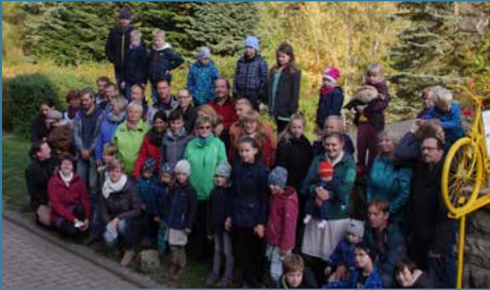
Familienrüstzeit in Rathen zum Thema "Vergebung"