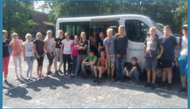
Mit den Konfirmanden des nächsten Jahrgangs im Kletterwald - unterstützt durch die Diakonie.