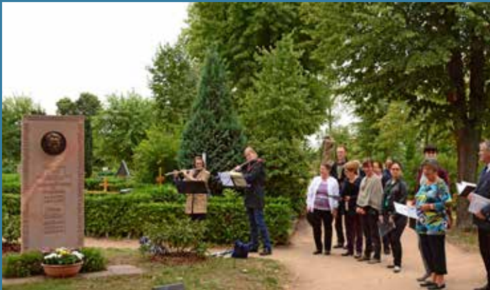
Einweihung des Gläser-Denkmal auf dem Friedhof Großenhain