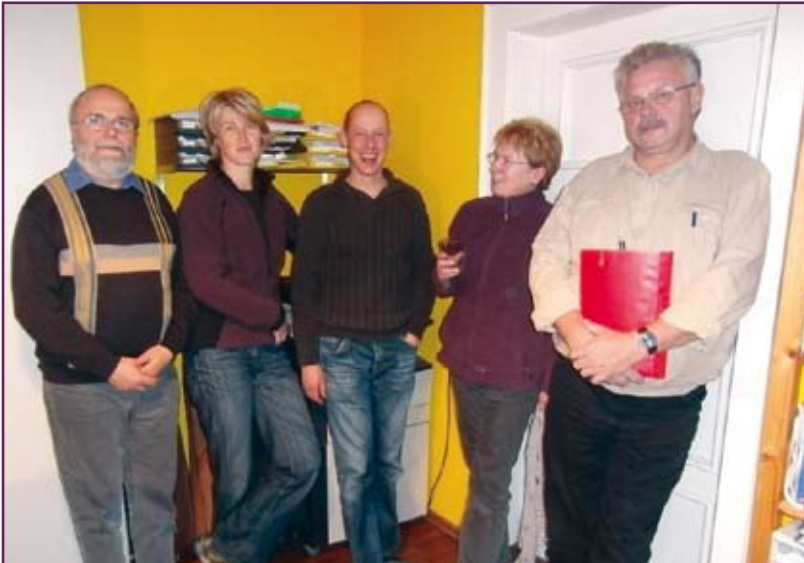
Unsere Kirchgemeindevvertretung

Am 03. März um 17.00 Uhr laden wir Sie herzlich zum Lobpreisgottesdienst ein. Wir freuen uns auf Zeit zum Singen, Beten und Hören auf Gottes Wort. Musikalisch begleiten uns Thomas Jauerka und Jörg Matthies. Achtung: Wegen der Witterung findet der Lobpreisgottesdienst in Seußlitz statt. Die Seußlitzer Kirche ist gut geheizt.