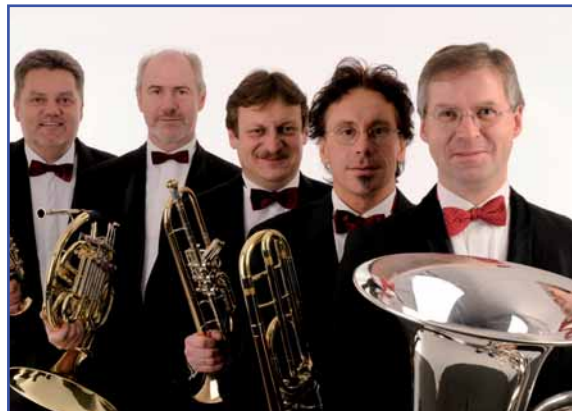
Das Blechbläserquintett vom MDR-Sinfonieorchester aus Leipzig

Ein Festkonzert zum Ausklang der Weihnachtszeit steht nach dem guten Zuspruch im Januar 2009 auch zu Beginn des kommenden Jahres auf dem Programm des Vokal- und Instrumentalensembles ars musica aus Großenhain. Unter dem Titel „Rorate caeli desuper“ gelangen früh- bis spätbarocke Kompositionen und Sätze des 16. bis 18. Jahrhunderts in vokaler und instrumentaler sowie gemischter Besetzung zur Aufführung. Eingebunden in das Konzert wird eine kleine Andacht, gehalten von Pfarrer Jörg Matthies. Die Leitung hat Jutta Reiß. Der Eintritt ist frei. Der Erlös der freiwilligen Spenden geht an die Stiftung „Lichtblick“.