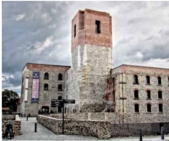
Im Schloss Großenhain findet im Januar unser Fest der Ehrenamtlichen statt.

Das Fest findet am 29. Januar ab 18.00 Uhr statt. Alle ehrenamtlichen Mitarbeiter/innen aus allen Gemeindebereichen sind dazu eingeladen! Es wird etwas zu essen geben und ein Unterhaltungsprogramm. Das Fest ist als Dankeschön an die Ehrenamtlichen gedacht und damit wird uns gegenseitig im Kirchspiel besser kennen lernen. Anmelden kann man sich in den Pfarrämtern Großenhain (03522 / 52 15 60) und Lenz (035 249 / 7 15 12) bis zum 8. Januar 2010. Wir bitten Sie, dass Sie Ihre Getränke selbst bezahlen.