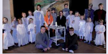
Klassik trifft Moderne - eine alte Geschichte im neuen Gewand

Mitwirkende: Kurrende Reinersdorf, Jugendchor Reinersdorf, Gymnasium Großenhain, Mittelschule Ebersbach, Männerchor Großenhain-Reinersdorf. Die Leitung hat Stefan Jänke. Das Projekt wird vom Kirchenbezirk Großenhain und von der Sparkasse Meißen unterstützt.