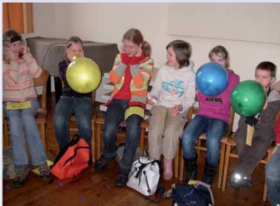
Wer bringt den Luftballon zum Platzen?