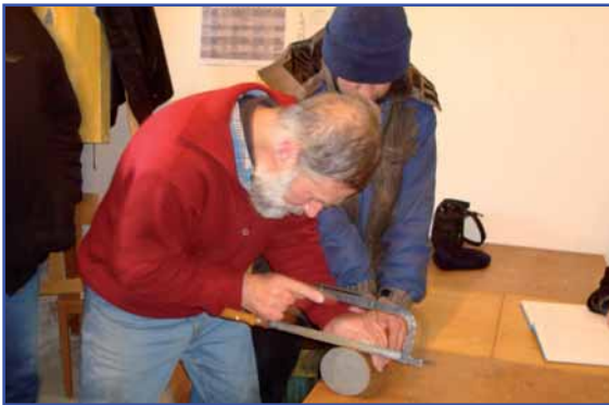
Mitarbeiter der Baufirma bergen den Schatz aus dem Turmknopf.

Spendenkonto: Ev.-Luth. Kirchenbezirk Dresden Nord LKG Sachsen eG Dresden BLZ 850 951 64 Kto.-Nr. 106 720 932 Rechtsträgernummer an: 1682 Verwendungszweck: Kirche Lenz