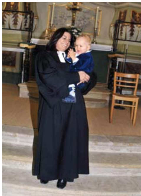
Jede Taufe ist ein Fest!

Wenn es dem großen Reformator Martin Luther schlecht ging, schrieb er auf den Tisch: „Ich bin getauft.“ Mit dieser Erinnerung an Gottes Versprechen fasste er neuen Mut. In der Taufe verspricht uns Gott, dass er uns in unserem Leben bewahren will. Er wusste, dass Gott uns schon bewiesen hat, dass sein Versprechen gilt. Wir Christinnen und Christen glauben, dass „der alte Mensch“, nämlich all das, was uns von einem Leben mit Gott und nach Gottes Geboten abhält, in der Taufe ertränkt wird. Der „alte Mensch“ stirbt, damit für den getauften Menschen ein neues Leben möglich ist. Das gilt nicht nur für dieses Leben. So wie dem Menschen durch die Taufe ein neues Leben in dieser