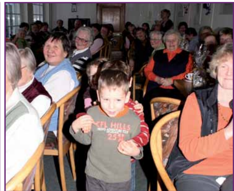
Die Kindergartenkinder aus Wildenhain erfreuten die Gäste der Helferfeier in der Orangerie mit Gedichten und Liedern zur Winter- und Weihnachtszeit.