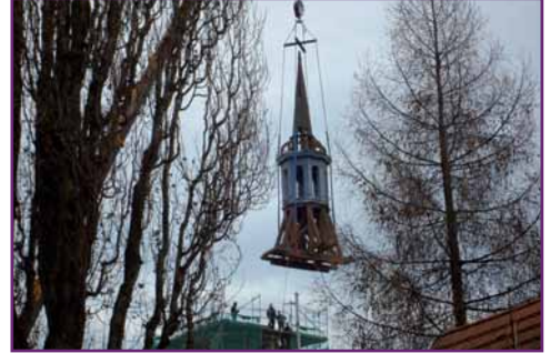
Da schwebt sie zu Boden; die Turmhaube der St.-Peter-Kirche Lenz.