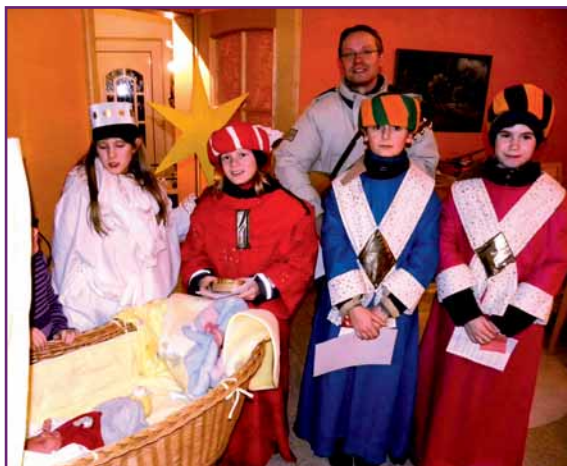
Die Sternsinger erreichen das erste Neugeborene im Landkreis Meißen (2010).

Fünf evangelische Sternsingergruppen waren Anfang Januar in Großenhain unterwegs. Viele Gemeindeglieder empfingen den Segen Gottes und öffneten ihre Türen und Herzen für den Gesang und die Anliegen der Kinder. Ein ganz herzliches Dankeschön gilt 21 Christenlehrekindern und 5 Muttis, die als Sternsinger und Betreuerinnen gemeinsam mit der katholischen Gemeinde 2.465,50 Euro für Kinder in anderen Ländern sammelten. Unsere fünf Gruppen haben 1.095 Euro zu diesem Gesamtergebnis beigetragen. Aufgrund der sehr positiven Resonanz soll im Jahr 2011 die Sternsinger-Aktion wiederholt werden.