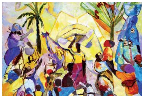
Der Weltgebetstag verbindet Menschen in aller Welt.