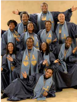
Bei „The Very Best Of Black Gospel“ zählt jedes einzelne Chormitglied zu den Besten seines Genres.