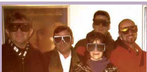
Mitarbeiterweihnacht - glückliche Ankunft auf dem Planeten "Pandora".

aufgebrochen; aha! Um die cineastische Reise heil zu überstehen, mussten wir 3-D-Brillen aufsetzen. Alle Mitarbeiter sind wieder heil zur Erde zurückgekehrt und konnten ihre Arbeit 2010 mit erweitertem Bewusstsein aufnehmen.