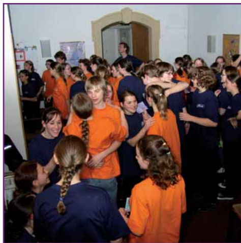
Die Mädchen und Jungen von Adonia nach einem Konzert in Freiberg.

Der Eintritt für das 20 Uhr beginnende Konzert ist frei. Eine Kollekte zur Deckung der Unkosten von Adonia wird erbeten. Wer sich vorab schon einmal über die Musicalarbeit informieren möchte, kann unter www.adonia.de nachschauen.