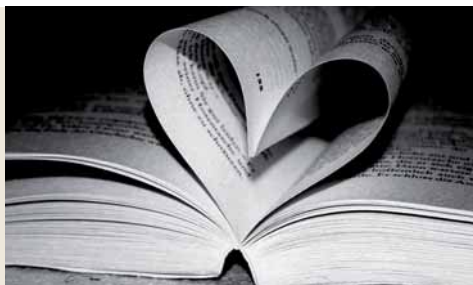
Woran hängst du dein Herz?

Das Nachsinnen über mich selbst und mein Leben findet ja nicht im Kopf statt. Es ist eine Herzenssache. Im Herzen bewegen wir die Dinge, die uns wirklich beschäftigen. Der Monatsspruch für den Monat September lautet (Lukas 12,34): „Wo euer Schatz ist, da wird auch euer Herz sein.“