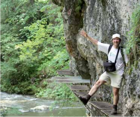
Ein übermütiger Leiter im Hornad-Durchbruch