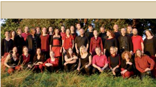
21 Frauen und 12 Männer bilden die 33köpfige Mannschaft der schwarzen und roten Wildrosen.