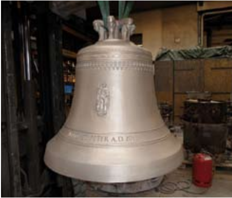
Glockenabnahme in Innsbruck