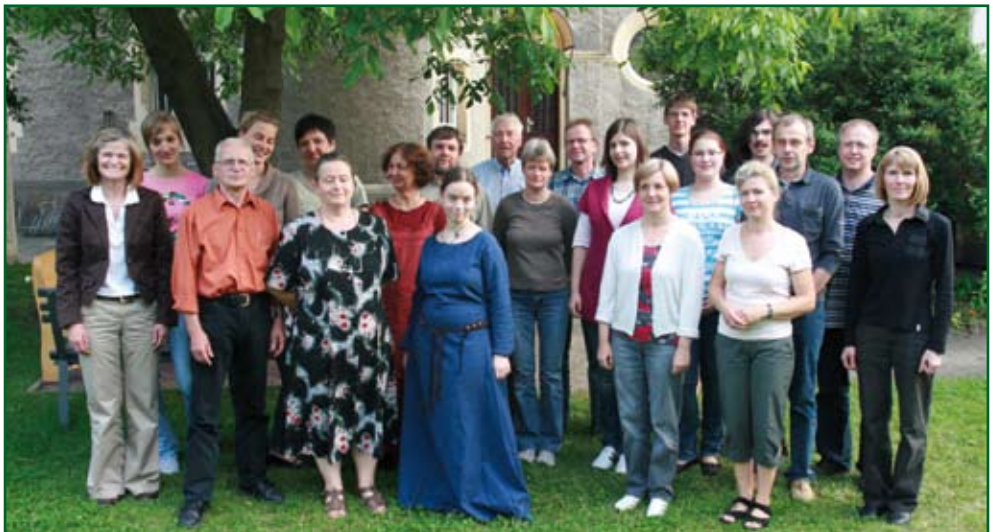
Katholischer Chor Großenhain

Sonnabend, 4. Dezember, 2. Advent 16.00 Uhr, Schlosskirche Seußlitz Konzert für Orgel und Trompete Joachim Schäfer, Trompete