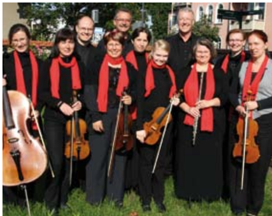
Instrumental- und Vokalensemble ars musica