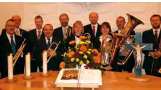
Das Blechbläserensemble „Musica 85“ wurde im Frühjahr 1985 von sieben ehemaligen Bausoldaten gegründet.

Das Blechbläserensemble „Musica 85“ hat seine Wurzeln in Prora auf der Insel Rügen, wo Anfang der 1980er Jahre etwa 400 Bausoldaten ihren Wehrdienst ableisteten. Viele der jungen Männer, die aus religiösen oder ethischen Gründen den Wehrdienst mit der Waffe ablehnten, waren in ihren heimatlichen Kirchgemeinden