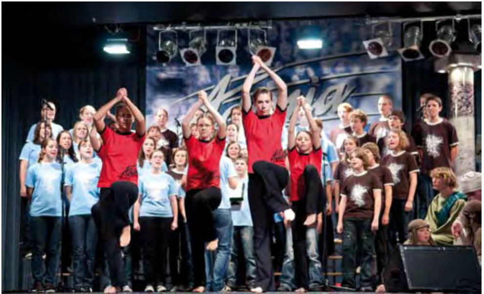
Die gehen voll ab. Die Adonia-Teens auf Deutschlandtournee 2010.