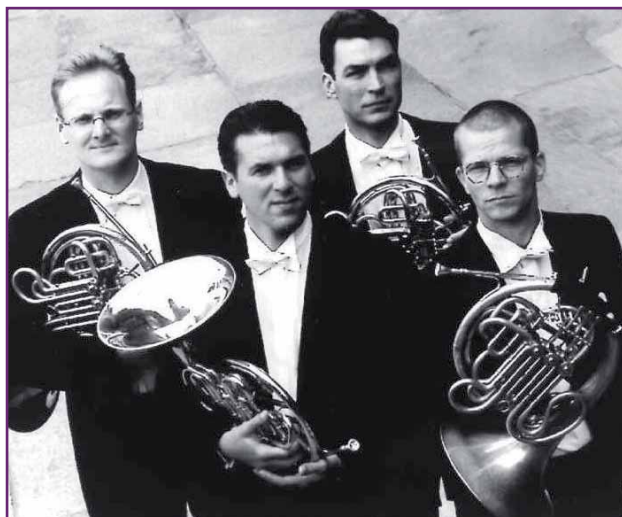
Jahresabschluss in Seußlitz - Konzert mit dem Leipziger Hornquartett

Kunstpries. Pfarrer Matthies wird im Rahmen dieses Konzerts eine Andacht halten. Eintritt: 10,- €. Karten können ab 15. November vorbestellt werden unter 03 52 67 / 5 52 92 und 0 35 22/ 5 21 56 10. Die Abendkasse ist ab 16.15 Uhr geöffnet. Veranstalter ist das Evangelisch-Luth. Kirchspiel Großenhainer Land.