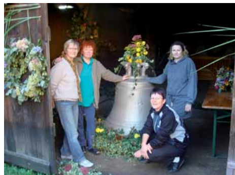
Einholung der Glocken in Lenz