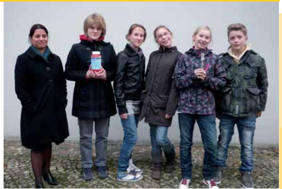
Nach getaner Arbeit: Konfirmanden der 7. Klasse entfernen Graffiti von der Kirche

Landeskirchliche Gemeinschaft (Kirchplatz 5) donnerstags, 19.30 Uhr