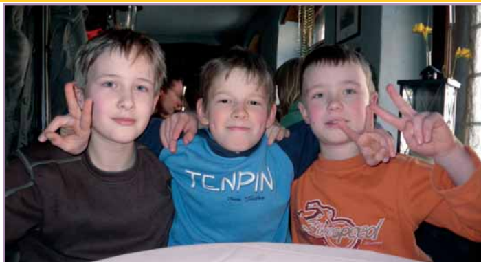
Freunde gesucht? Komm zur Kibiwo 2011!

Die Kinder der 1. - 7. Klassen sind in den Winterferien herzlich zur Kinderbibelwoche eingeladen. Die Teilnahme an der Kinderbibelwoche kostet 25 €. Dafür gibt es wieder ein volles Programm mit dem Thema des Kirchentags in Dresden „.....da wird auch dein Herz sein.“, mit Bibel, Spaß, Spiel und Bastelmaterial, Mittagessen und einen Ausflugstag. Genauere Informationen erhalten die Kinder ab dem 10. Januar in der Christenlehre.