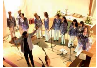
1. Swing-go-pop Chor Brandenburg

Konzert zum Abschluß des Großenhainer Bauernmarktes mit Brandenburgs 1. Swing-go-pop Chor