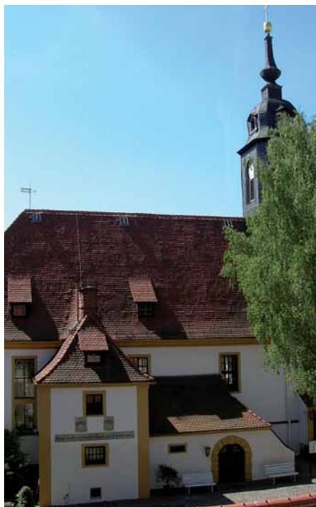
Schlosskirche Seußlitz