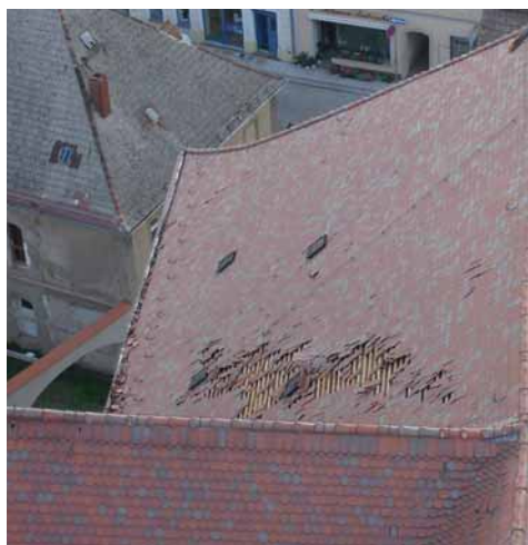
Sturmschäden an der Marienkirche

Die anderen kirchlichen Gebäude in Großenhain haben im Vergleich nur geringe Sturmschäden davongetragen, die Dorfkirchengemeinden des Kirchspiels blieben von der Katastrophe verschont.