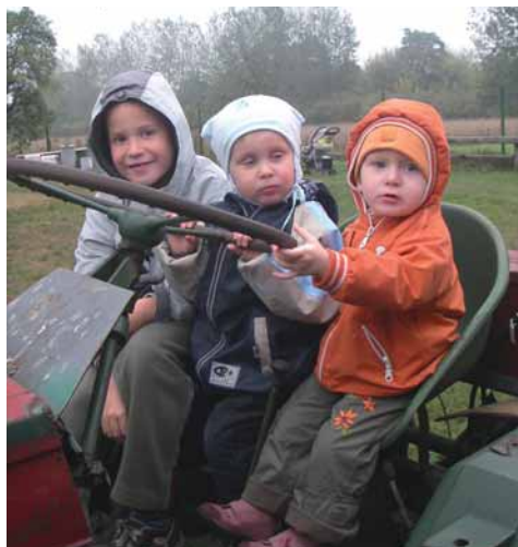
Kinder (und Eltern) auf nach Schmannewitz!