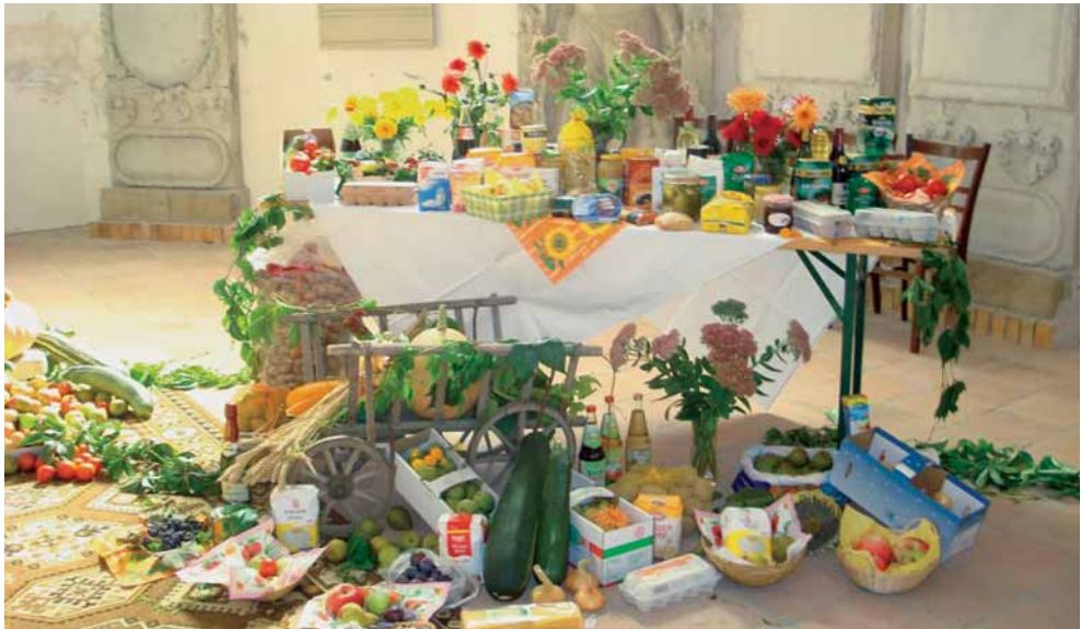
Erntedank in Lenz

Im September wird die Junge Gemeinde Lenz den Jugendgottesdienst des Kirchenbezirks Großenhain ausgestalten. Herzliche Einladung am 26. September um 17.00 Uhr zu einem garantiert besonderen Gottesdienst in der Merschwitzer Kirche.